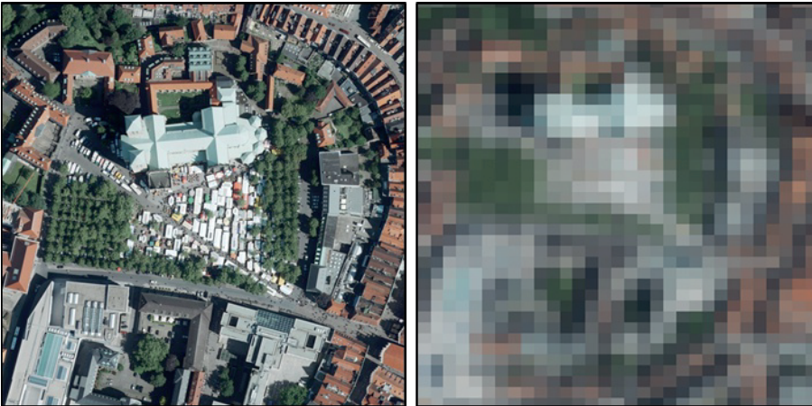
Abb. 2a: Ein DOP der Landesvermessung mit einer Bodenauflösung von 10 cm

Abbildung 2a zeigt ein Digitales Orthophoto (DOP) mit 10 cm Bodenauflösung, dem aktuellen Standard der nordrhein-westfälischen Landesvermessung. In Abbildung 2b wurde der gleiche Bildausschnitt in eine Bodenauflösung von 10 m umgerechnet. 10 m entsprechen der Auflösung, wie sie Sentinel-2 des Copernicus-Programms liefern kann. Vergleicht man die beiden Abbildungen 2a und 2b, scheint die eingangs gestellte Frage leicht zu beantworten zu sein.